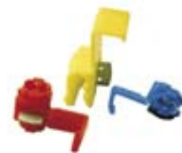
svorka dvou vodičová